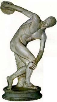
El discóbolo de Mirón